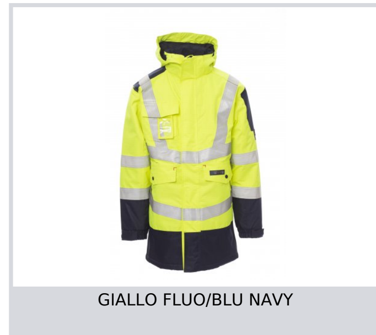
GIALLO FLUO/BLU NAVY